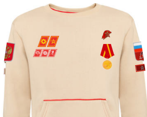
Размещение знаков различия, знаков отличия и иных геральдических знаков на толстовке бежевого цвета