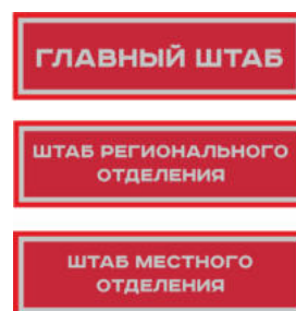
Нарукавный знак, устанавливающий принадлежность к структуре органов ВВПОД «ЮНАРМИЯ»