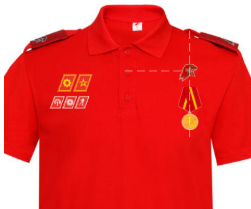
Размещение знаков различия, знаков отличия и иных геральдических знаков на рубашке поло красного (синего) цвета