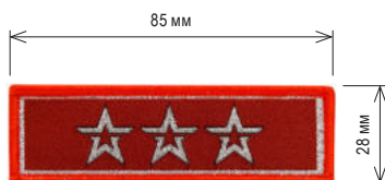
Нарукавный знак, определяющий принадлежность к ВВПОД «ЮНАРМИЯ»