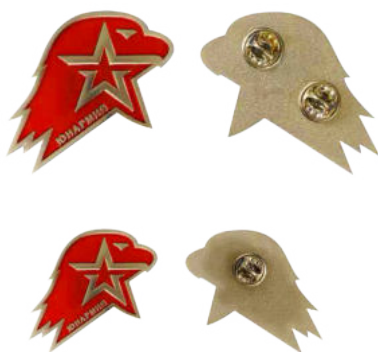
Большая (кокарда) и малая (значок) эмблема ВВПОД «ЮНАРМИЯ»