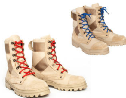
Ботинки с высокими берцами утеплённые бежевого цвета со шнурками красного (синего, бежевого) цвета