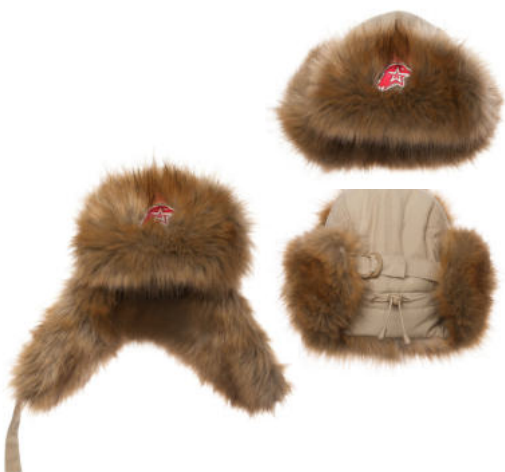
Шапка-ушанка бежевая с искусственным мехом коричневого цвета