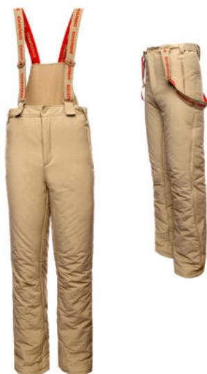
Брюки утеплённые (тактические) бежевого цвета