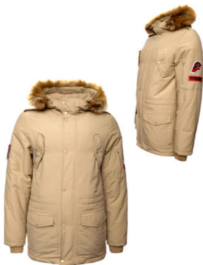
Куртка зимняя утеплённая бежевая с капюшоном и отделкой к капюшону из искусственного меха коричневого цвета