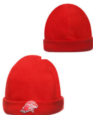
Шапка флисовая вязаная красного цвета