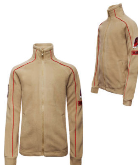
Жакет флисовый бежевого цвета