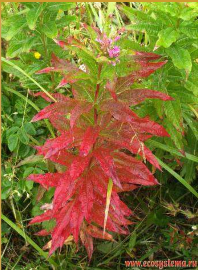
Иван-чай узколистный ( Chamaenerion angustifolium (L.) Moench.). Тихоокеанское побережье, Халактырский пляж