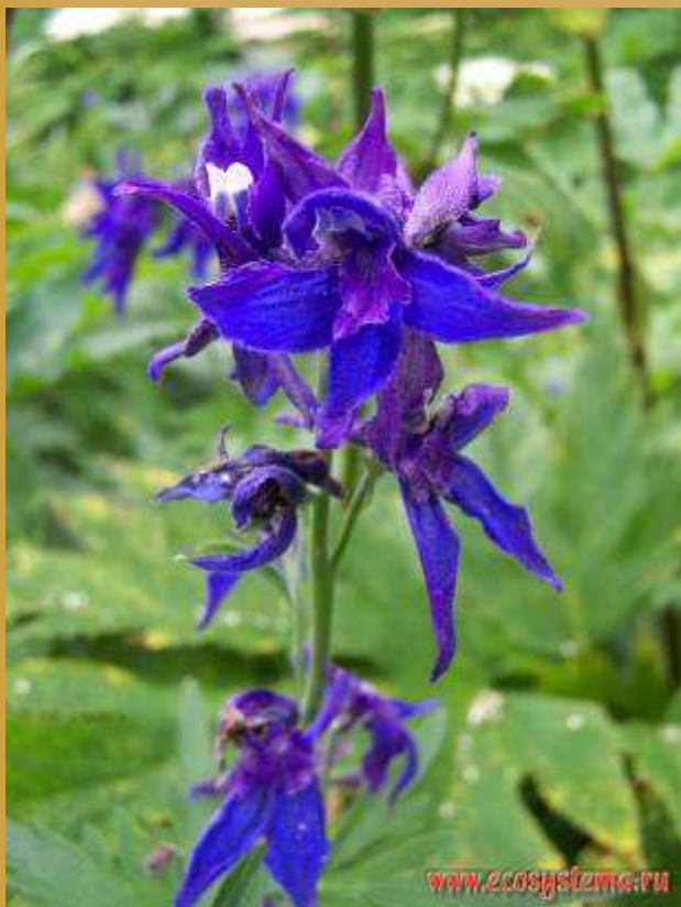
Живокость, или дельфиниум, шпорник ( Delphinium sp.)