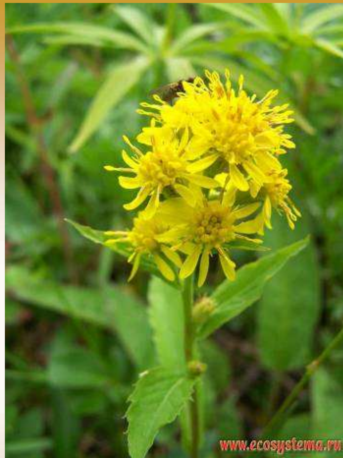
Бузульник ( Ligularia sp.)