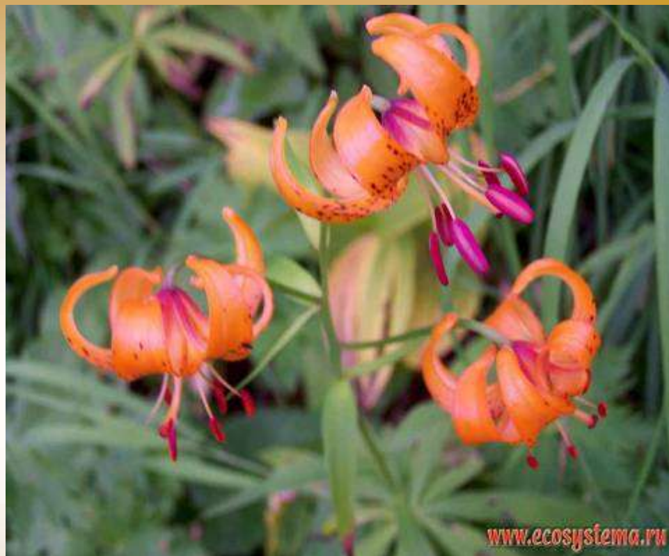
Лилия кудреватая, или саранка, бадун, царские кудри, маслянка ( Lilium martagon L.)